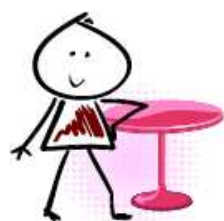
Table ronde d'OUVERTURE

Lundi 1 er novembre 2010, de 18h à 20h Au Lausanne Palace, Lausanne